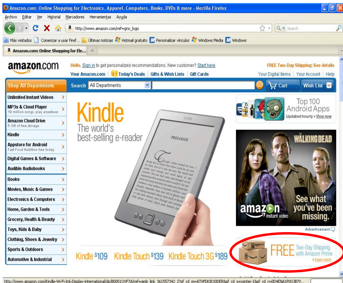
Imagen 1: Extraída de Página de inicio de Amazon.com, disponible en www.amazon.com

Hay otros sitios donde se puede comprar más barato, pero Amazon tiene una buena atención al cliente y se preocupa porque sus clientes estén satisfechos. Esta orientación al cliente hace que, éstos, se conviertan en fieles al sitio. Además de la atención al cliente y la asesoría en la compra, Amazon, fideliza a sus clientes a través de programas como el tiempo Prime en el que los clientes pueden acceder a envíos gratuitos pagando una cuota anual de alrededor de 79 dólares, lo que les representa un ahorro considerable al finalizar el año y a Amazon le garantiza el hecho de que estos clientes cuando necesiten un producto, lo busquen en su página antes que en cualquier otra tienda, virtual o no (artículos online, Pueyrredon).