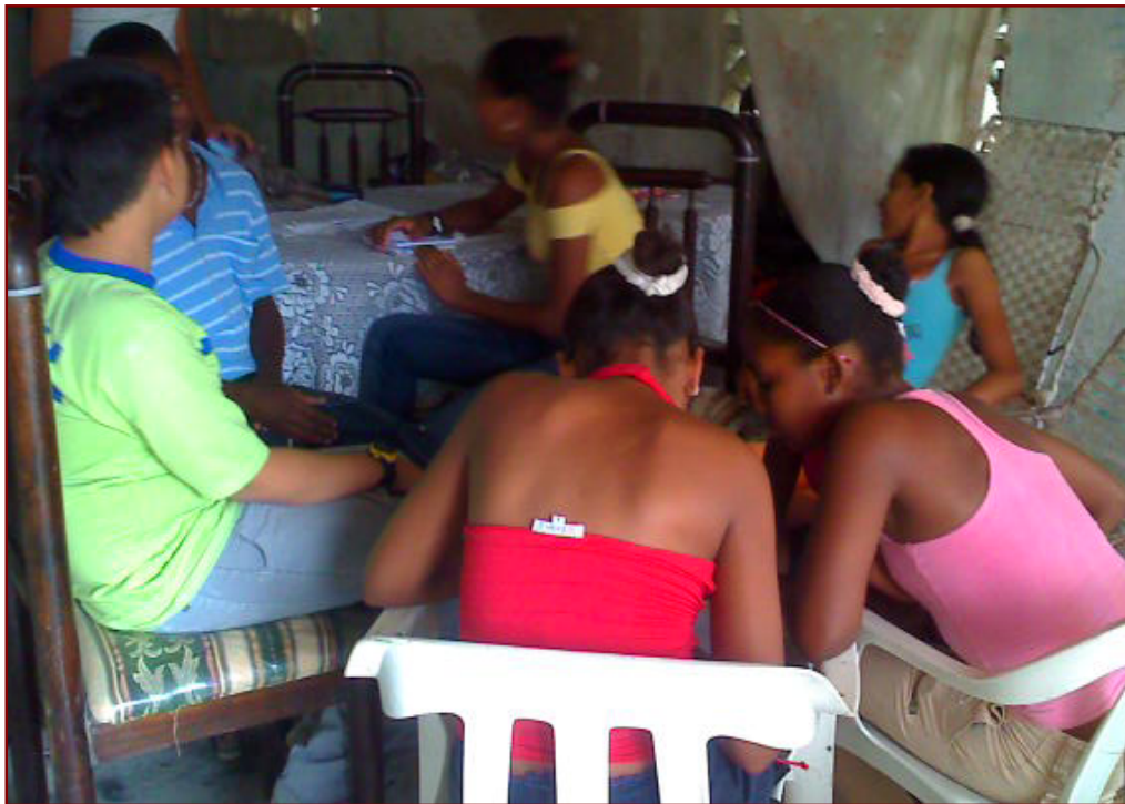
Invitaron a sus compañeros a trabajar en el proyecto. Entrevista a estudiantes y profesores sobre que opinaban del pandillismo.