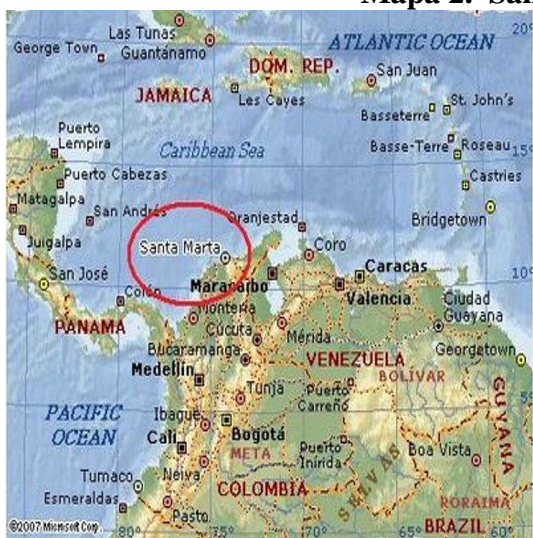
Mapa 2. Santa Marta. Colombia.