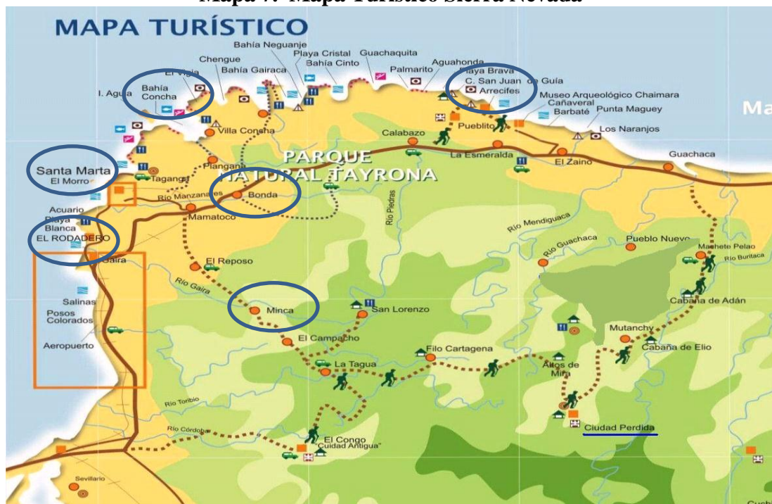
Mapa 7. Mapa Turístico Sierra Nevada