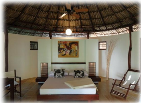
Echohotel : Sierra Nevada de Santa Marta