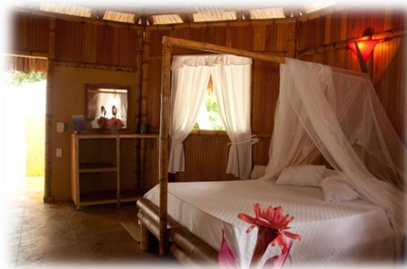
Echohotel: Sierra Nevada de Santa Marta

Luego de haber realizado las visitas de campo a la zona objeto de estudio, con las cuales buscaba determinar la planta turística con la que contaba la región para determinar con cuáles operadores turísticos se podría trabajar en pos de la calidad del circuito turístico a diseñar. Así, en el tema de Alojamiento, se decidió que las posadas turísticas, los eco-hoteles y eco-habs son ideales para ir acordes con la temática del mismo, más que escoger hoteles. Así por ejemplo dentro de la oferta de alojamiento se ha seleccionado una cabaña en el Parque Tayrona con capacidad para 10 personas.