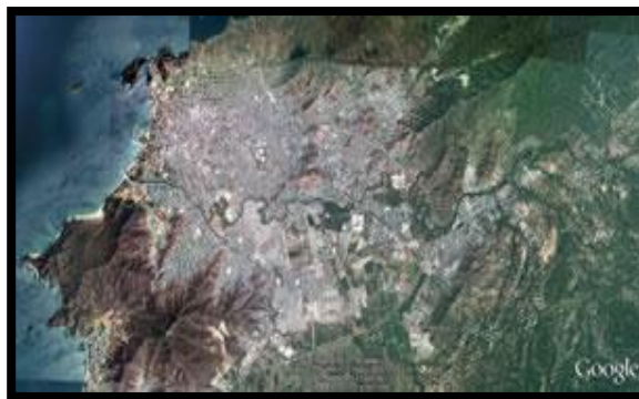
Mapa. Relieve D.T.C.H de Santa Marta