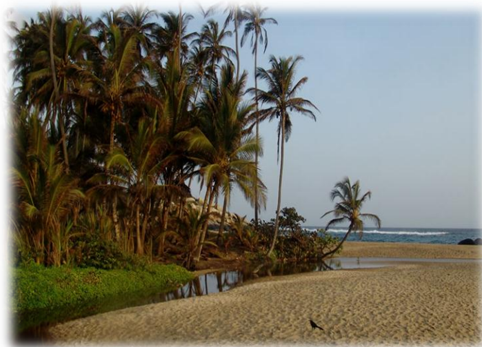
Bahía Concha: playa ubicada dentro del PNNT.