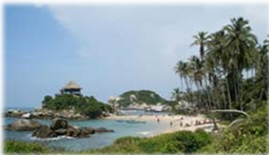
Playa del Cabo y San Juan del Guía: playa ubicada dentro del PNNT