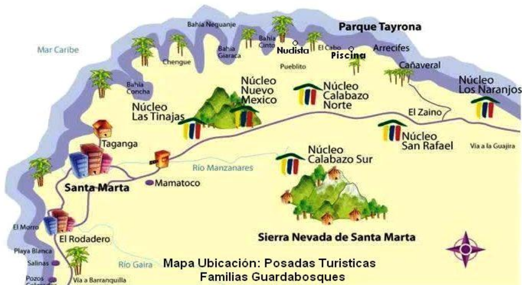
Mapa 6. Posadas Turísticas parque Tayrona

Las posadas turísticas son típicas viviendas donde no existe amplia infraestructura hotelera. Están concebidas para turistas amantes de la naturaleza y aventura, a quienes no les interesa dormir en hoteles cinco estrellas, “pero sí en acogedoras estaciones para sentir el verdadero descanso armonizado por la riqueza cultural de las regiones y la música de la naturaleza” (Viceministerio de Turismo, 2015). En el Tayrona se encuentran 5 núcleos: Las Tinajas, Nuevo México, Calabazo (Norte y Sur), San Rafael y los Naranjos (Mapa 6)