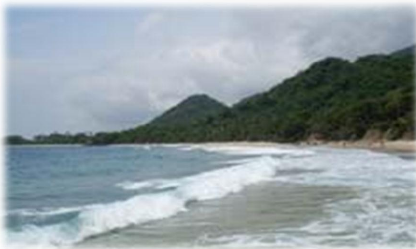
Playa Naturista: playa ubicada dentro del PNNT.