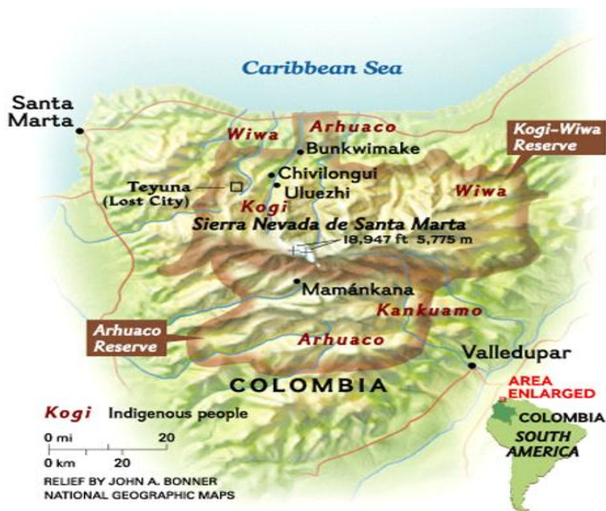
Mapa 5. Pueblos Indígenas de la Sierra Nevada de Santa Marta

Aunque el patrimonio inmaterial no es tan fácilmente perceptible a través de las imágenes, es claro que para el caso del destino en estudio, el patrimonio inmaterial está íntimamente ligado a las costumbres y creencias de los diversos pueblos indígenas que habitan en la zona (Mapa 5).