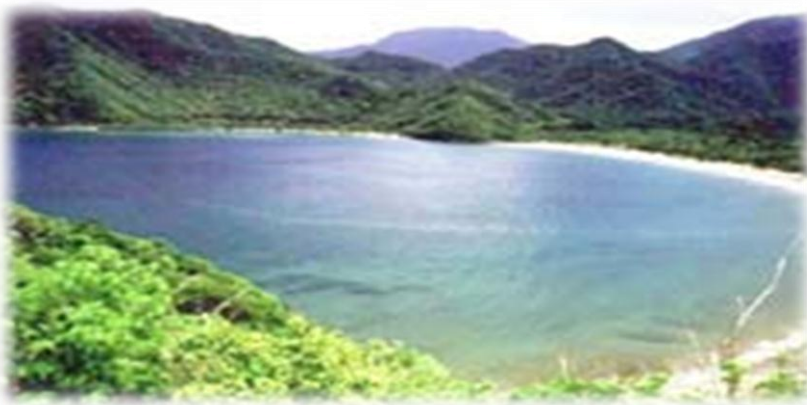
Neguange: playa ubicada dentro del PNNT.