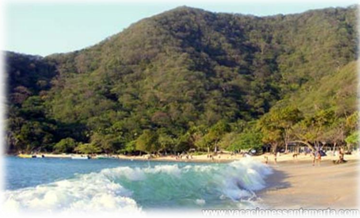
Playa Cristal: playa ubicada dentro del PNNT.