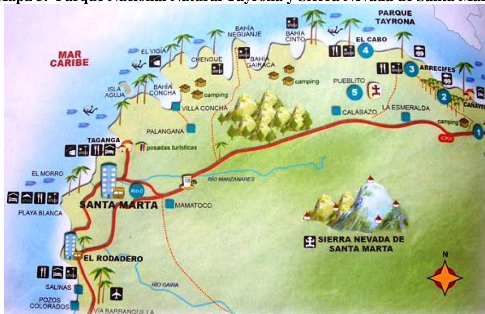
Mapa 3. Parque Nacional Natural Tayrona y Sierra Nevada de Santa Marta

Fuente: 06150 Código postal de Santa Marta