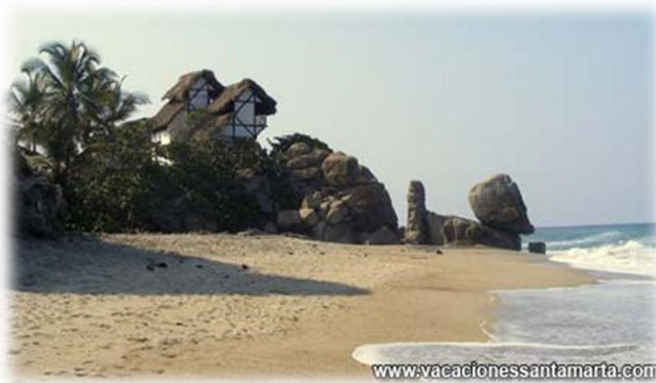
Los Naranjos: playa ubicada dentro del PNNT.