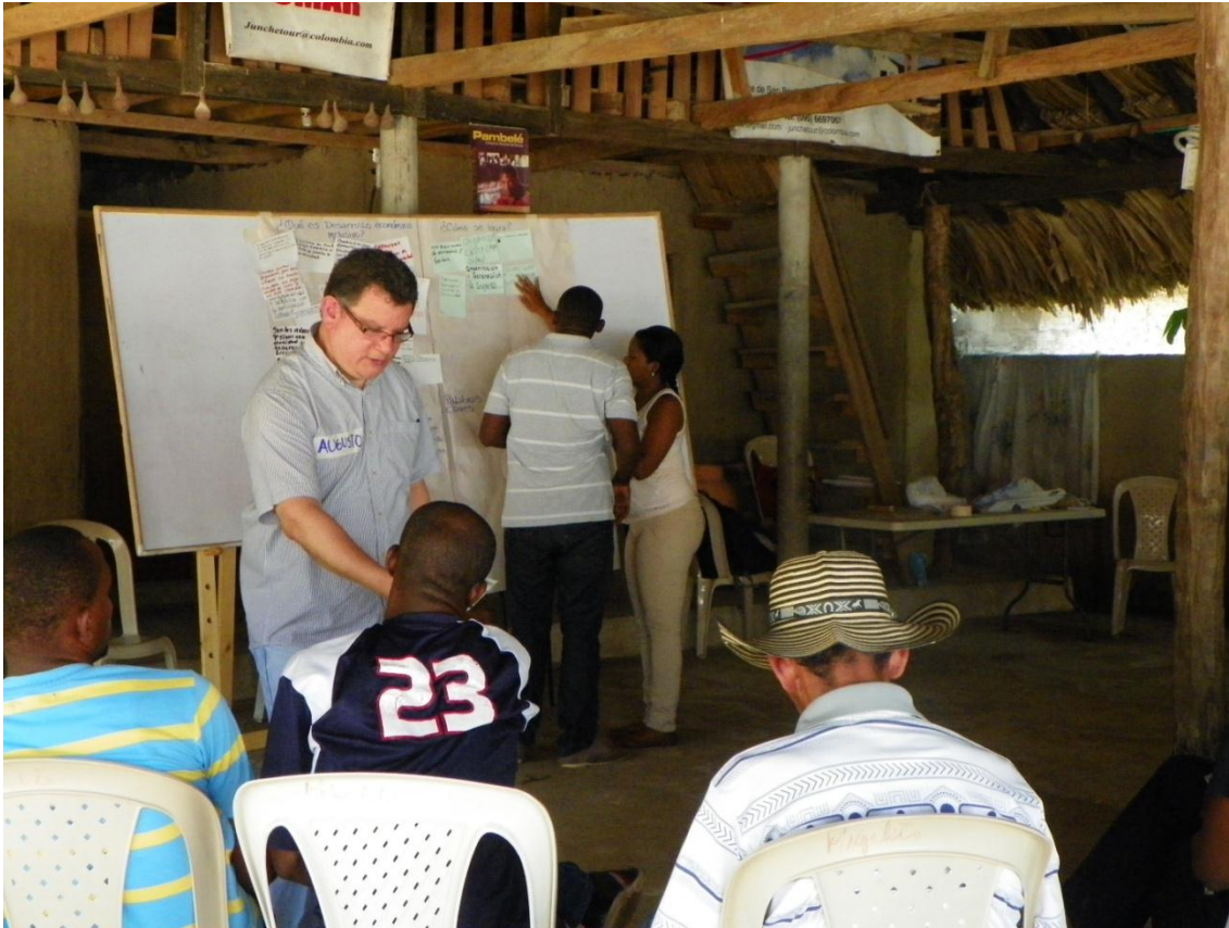
Foto: Tomada en el Taller Participativo, San Basilio de Palenque, Septiembre 2013

bajos ingresos y condición de vulnerabilidad, a fin de garantizar el ejercicio pleno de sus derechos de manera autónoma y con mayores posibilidades de lograr el desarrollo humano.