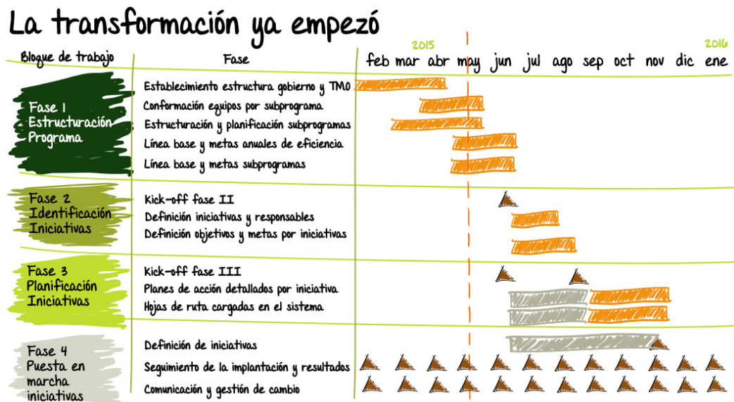
Figura 1. Cronograma de transformación de Ecopetrol

Previamente a este cronograma, se realizó el diagnóstico de Ecopetrol con la participación de Boston Consulting Group , para ello se realizaron visitas en las localidades de Barrancabermeja, Cartagena y Llanos Orientales en las que se revisaron diversos detalles operacionales: políticas administrativas y de contratación local de Ecopetrol (composición