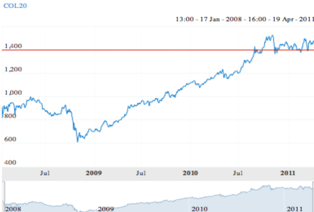
Grafica 2. INDICE COL20 2008-2011

Fuente: Realizado por el autor con información extraída de la página de la BVC.