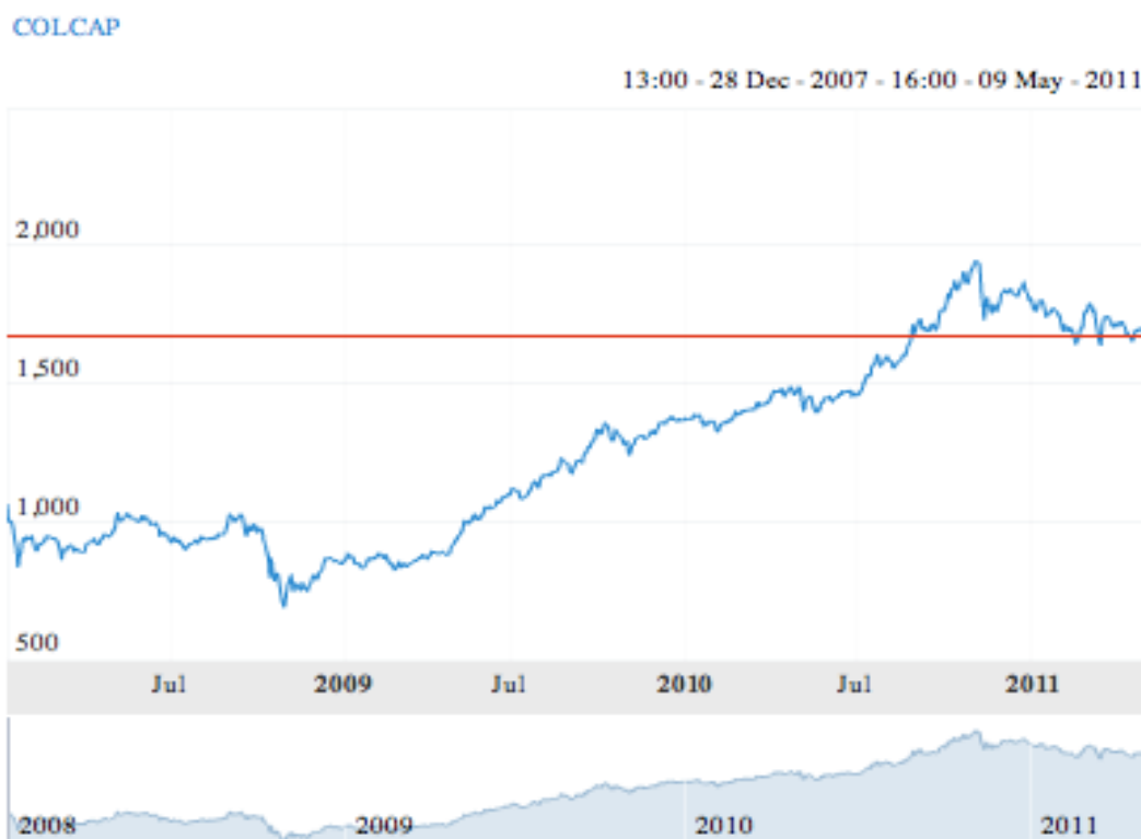
Grafica 3. INDICE COLCAP 2007-2011

Fuente: Realizado por el autor con información extraída de la página de la BVC.