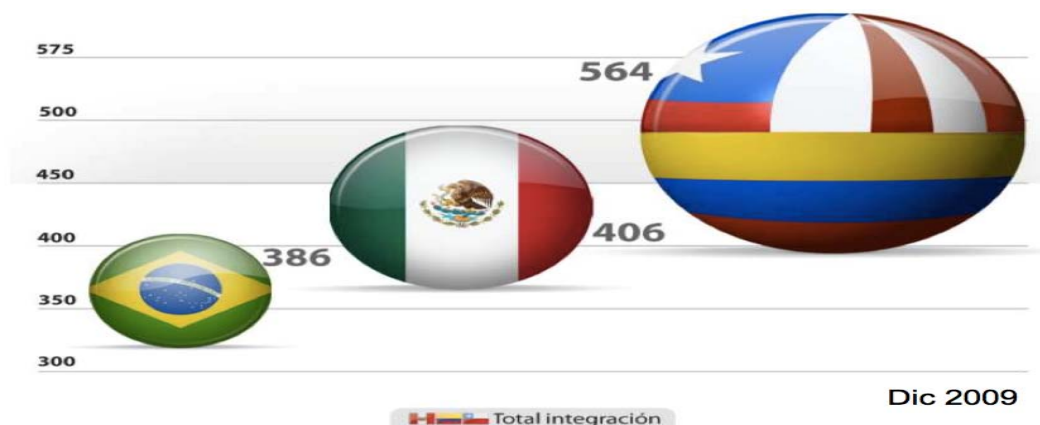
Grafica 5. Valores de las emisiones de dólares