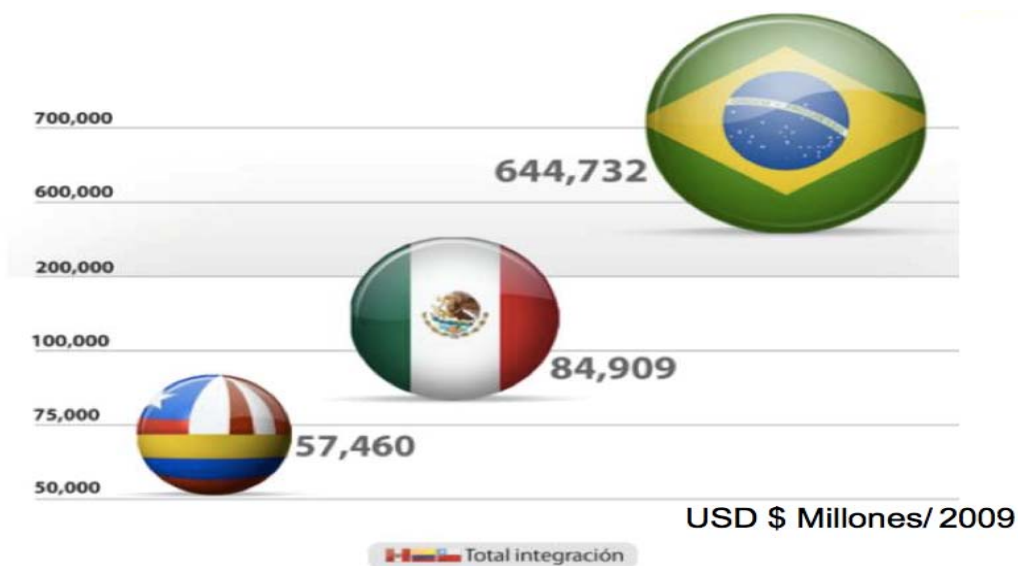
Grafica 7. Volumen de negociación