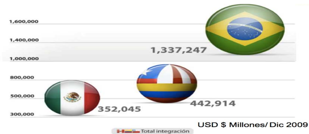
Grafica 6. Capitalización bursátil del mercado