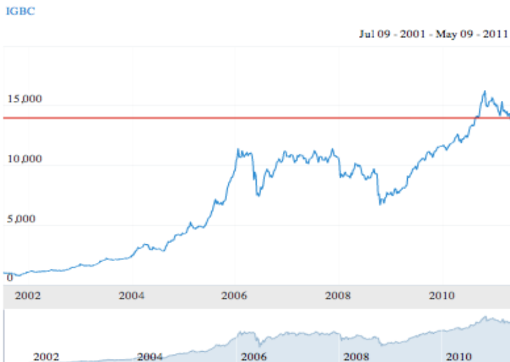
Grafica 1. INDICE IGBC 2001-2011

Fuente: Realizado por el autor con información extraída de la página de la BVC.