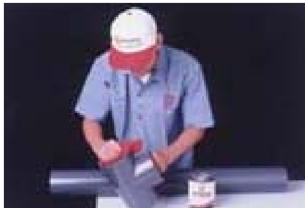
Figura 3. Proceso Fitting