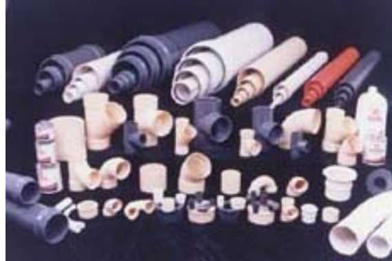
Figura 2. Accesorios en p.v.c

Después de la elaboración de tubería PVC pasan a la maquina de inyección donde se elabora los diferentes accesorios tales como uniones, codos y acoplamientos.