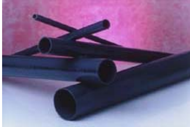
Figura 1. Tubos en p.v.c

Una vez que llegan la bolsas empacadas que vienen del mezclador, se arranca la maquina extrusora para dar inicio a la producción de la tubería P.V.C. la cual se hacen en diferentes diámetros de acuerdo a los moldes colocados en la maquina extrusora.