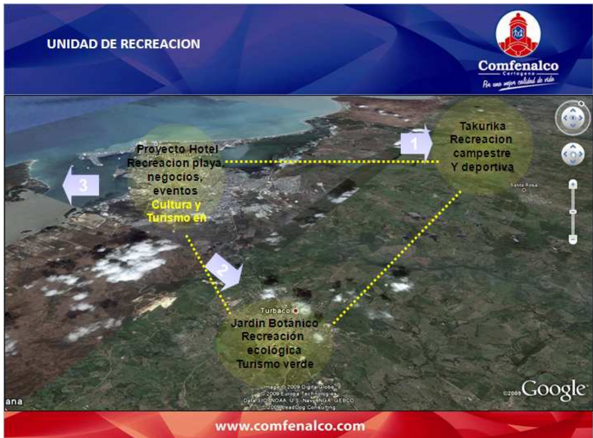
Grafico No. 2: Triángulo de Recreación año 2007: