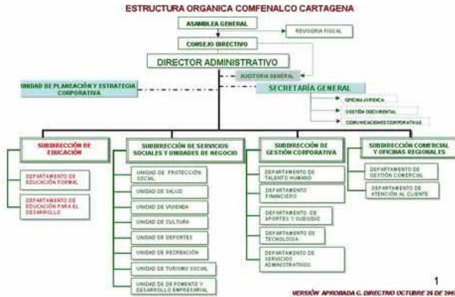
Grafico No. 1: Estructura organizacional Comfenalco Cartagena año 2007: