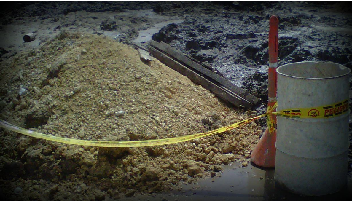
Imagen 1. “No pasamos de ser barro”