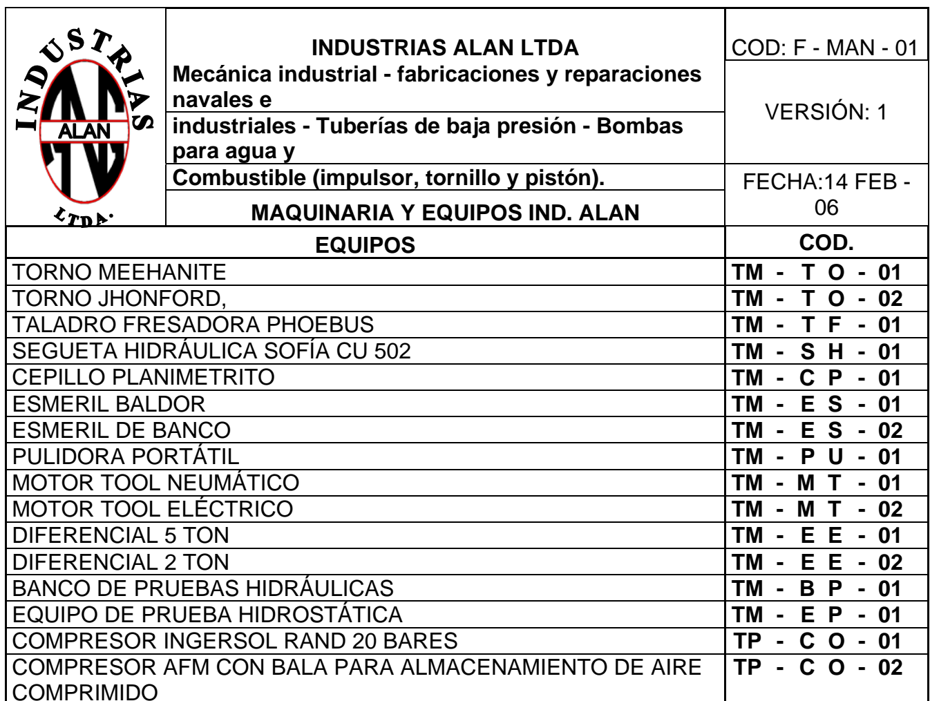
TABLA N° 6. Maquinaria y equipos Ind. Alan