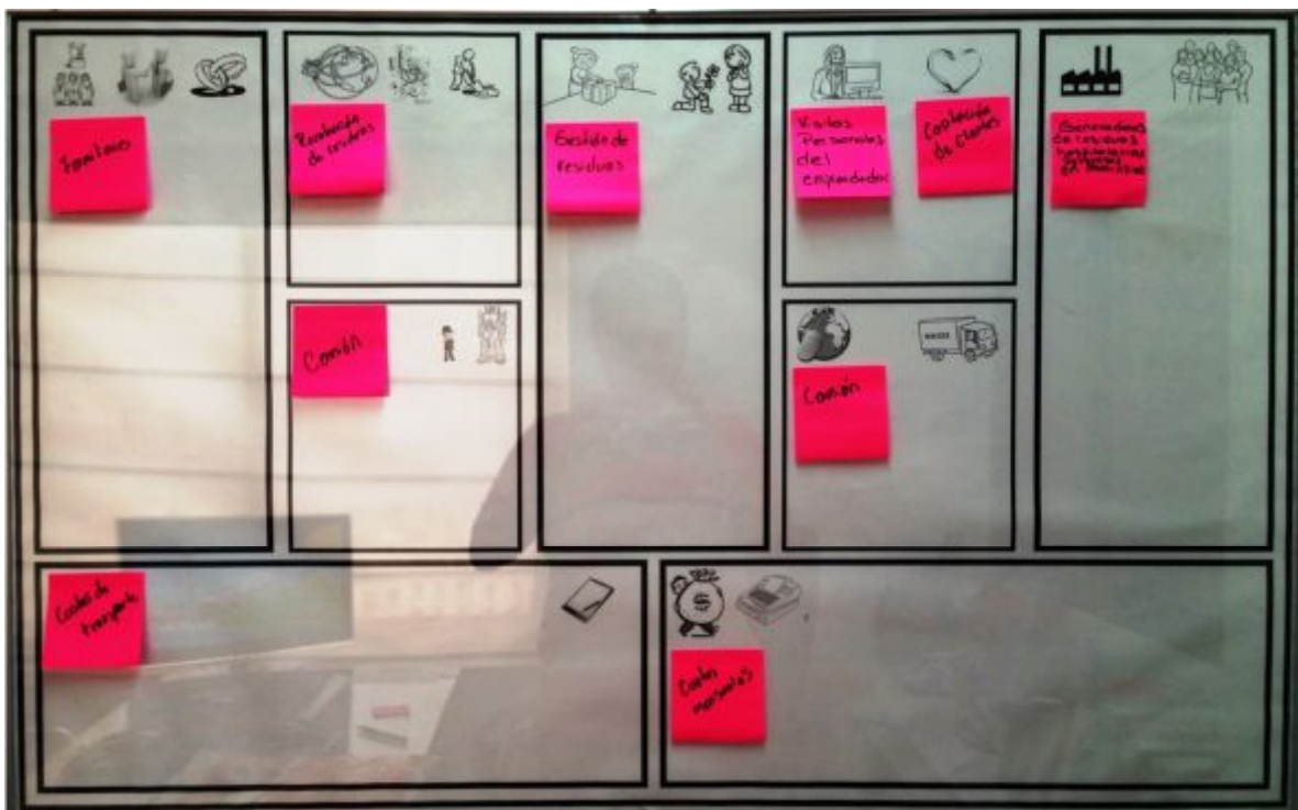
Ilustración 2. Lienzo de Modelo de Negocios inicial.