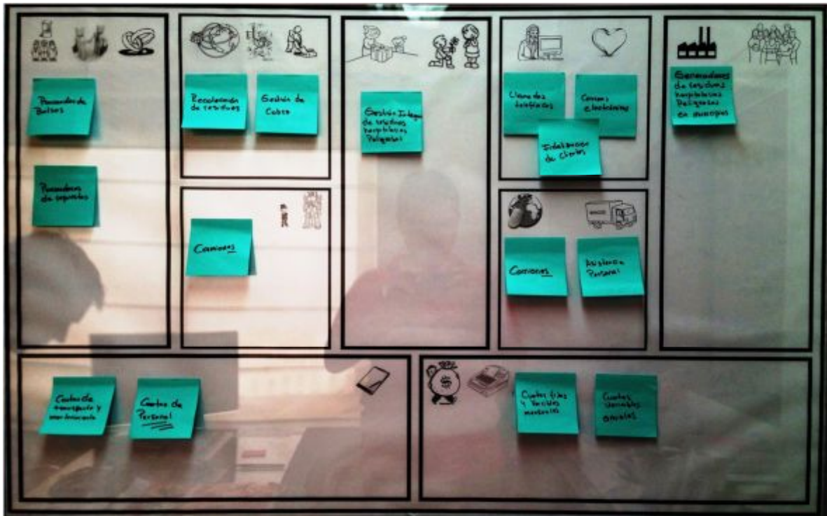
Ilustración 4. Lienzo de Modelo de Negocios actual.