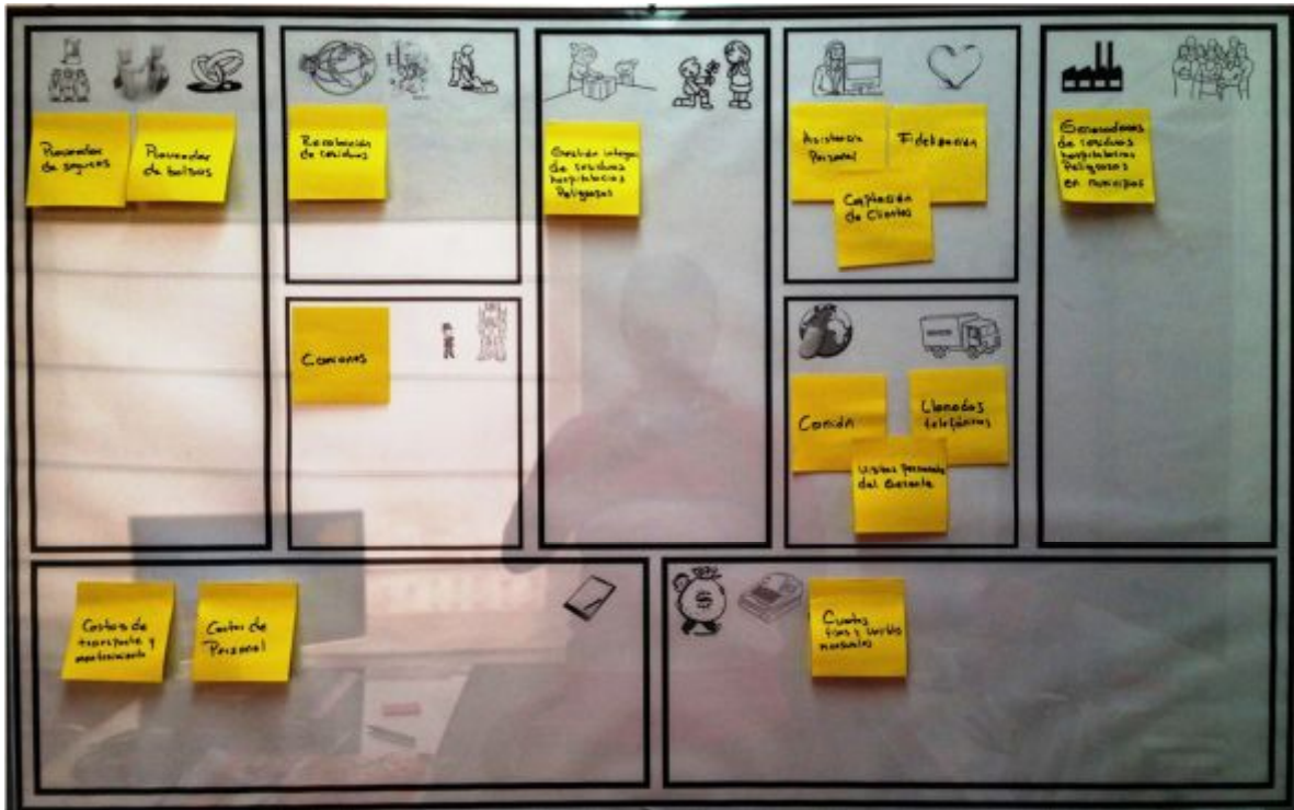
Ilustración 3. Lienzo del segundo Modelo de Negocios.