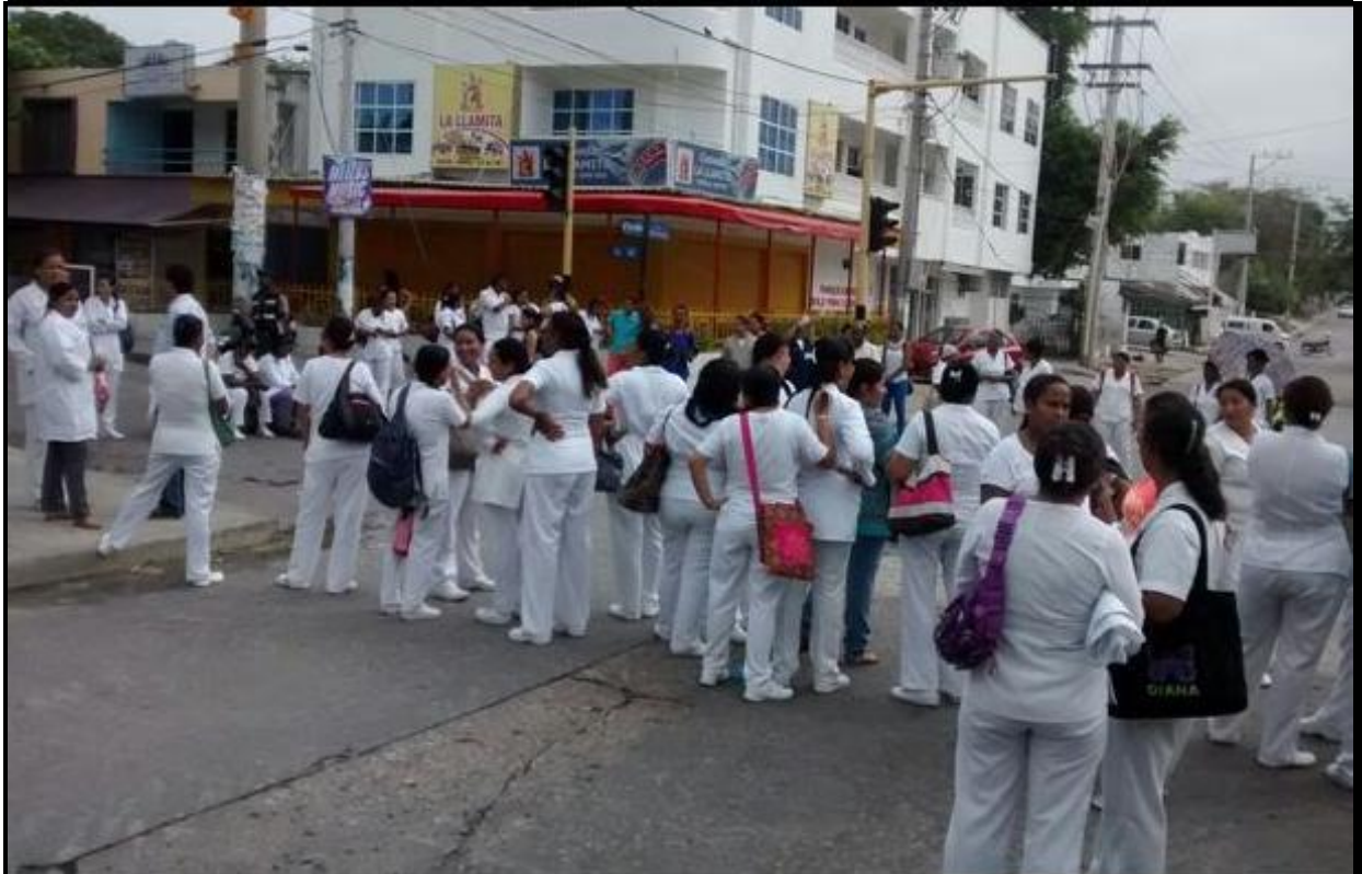
Protesta de trabajadores del Hospital Universitario del Caribe en la avenida El Consulado.

Anexo 11. Trabajadores del HUC protestan en la avenida El Consulado