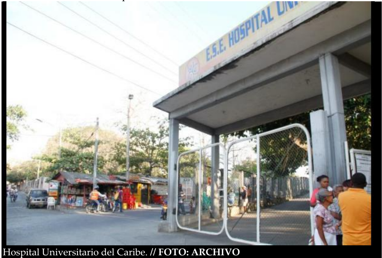
Hospital Universitario del Caribe.

Empleados del área de radiología del HUC completan cuatro días en paro EL UNIVERSAL @ElUniversalCtg Cartagena 16 de Febrero de 2016 04:14 pm