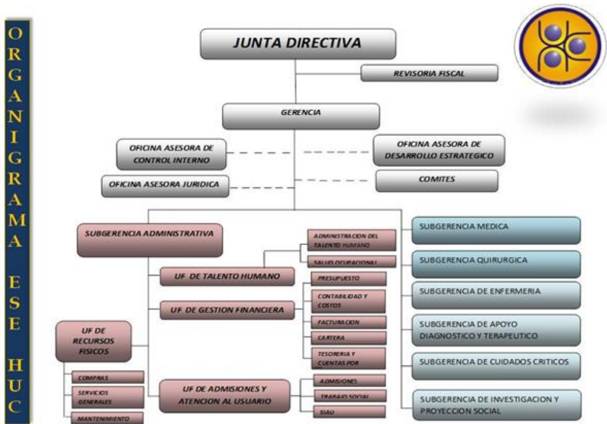
Grafica 3. Organigrama ESE Hospital Universitario del Caribe

Vale la pena anotar, que la alta gerencia de la ESE Hospital Universitario del Caribe, está constituida por el Gobernador del departamento de Bolívar como presidente de la junta directiva, el señor Alcalde del distrito de la ciudad de Cartagena de Indias, D. T y C, miembros de las asociaciones científicas, miembros de la liga de usuarios, el Rector de la Universidad de Cartagena y funge como secretaria la Gerente del hospital.