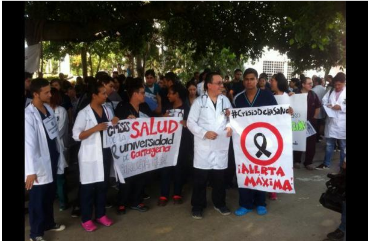
Anexo 10. Trabajadores del HUC se unen a protestas nacionales por crisis en salud