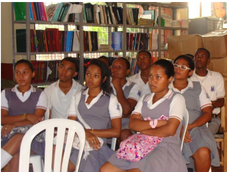
Alumnos de undécimo grado de la Institución Educativa Playas de Acapulco que pertenecen al nivel socio-económico uno y dos de la ciudad de Cartagena