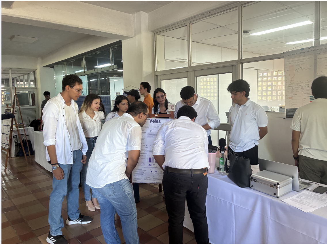
Figura 7.1: Todos nuestros chicos de la Feria de Ciencias de Datos en el Data Impact Day de los cursos de Machine Learning.