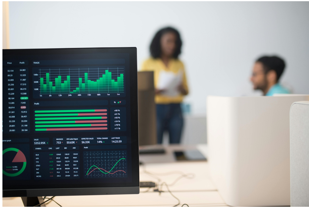
Figura 1.1: Modern office with financial trading screens and a diverse team discussing strategies.