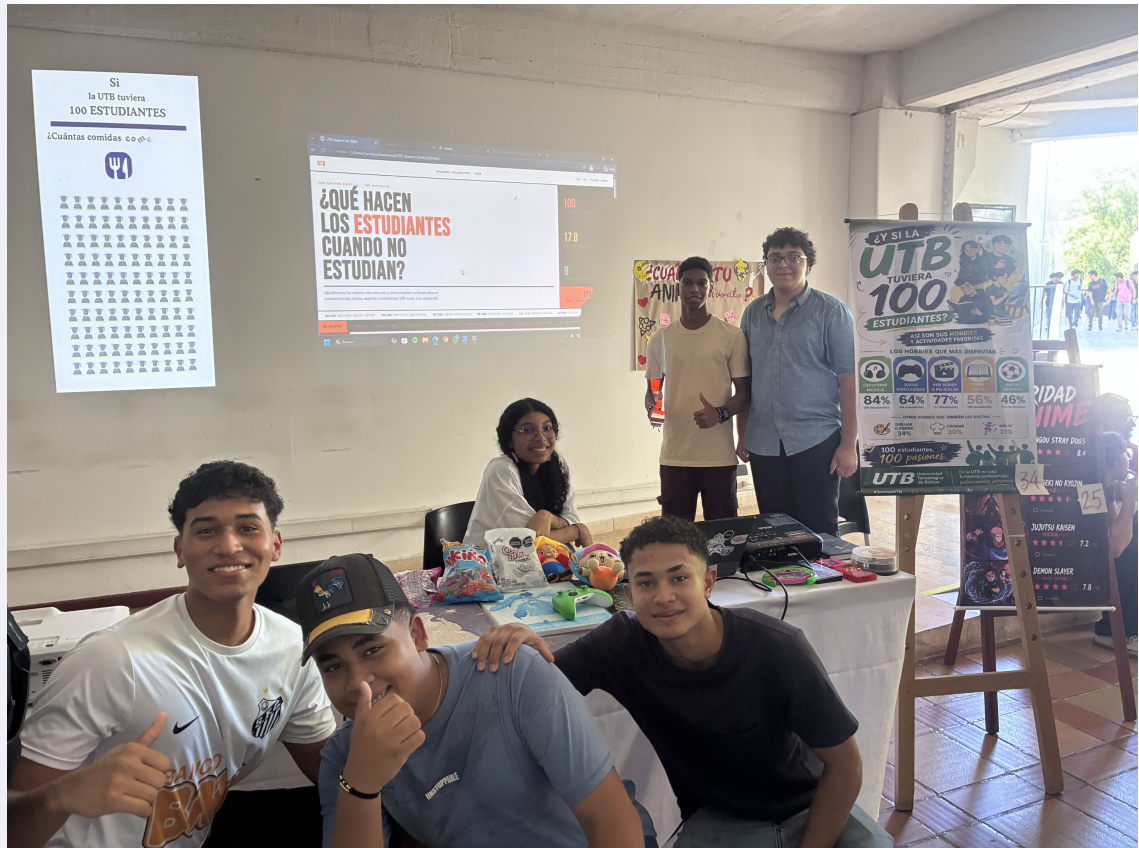
Figura 3.1: Todos nuestros chicos de la Feria de Ciencias de Datos en el Data Impact Day de los cursos de Introducción a la Ciencia de Datos.

Este proyecto analiza la relación entre la población estudiantil de la Universidad Tecnológica de Bolívar y su vínculo con la tecnología en hábitos de aprendizaje, representando los resultados sobre una muestra proporcional de 100 estudiantes. Se examinaron variables como hábitos de estudio, uso de herramientas tecnológicas, salud mental y manejo del tiempo libre. Los hallazgos se presentan en proporciones claras que facilitan la comprensión de los patrones predominantes en la comunidad universitaria.