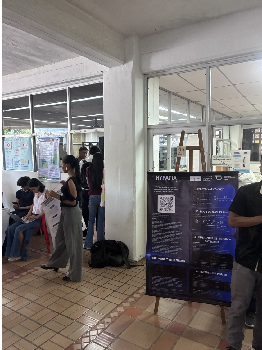
Figura 6.1: Todos nuestros chicos de la Feria de Ciencias de Datos en el Data Impact Day de los cursos de Sensado y Modelado de Sistemas Físicos.