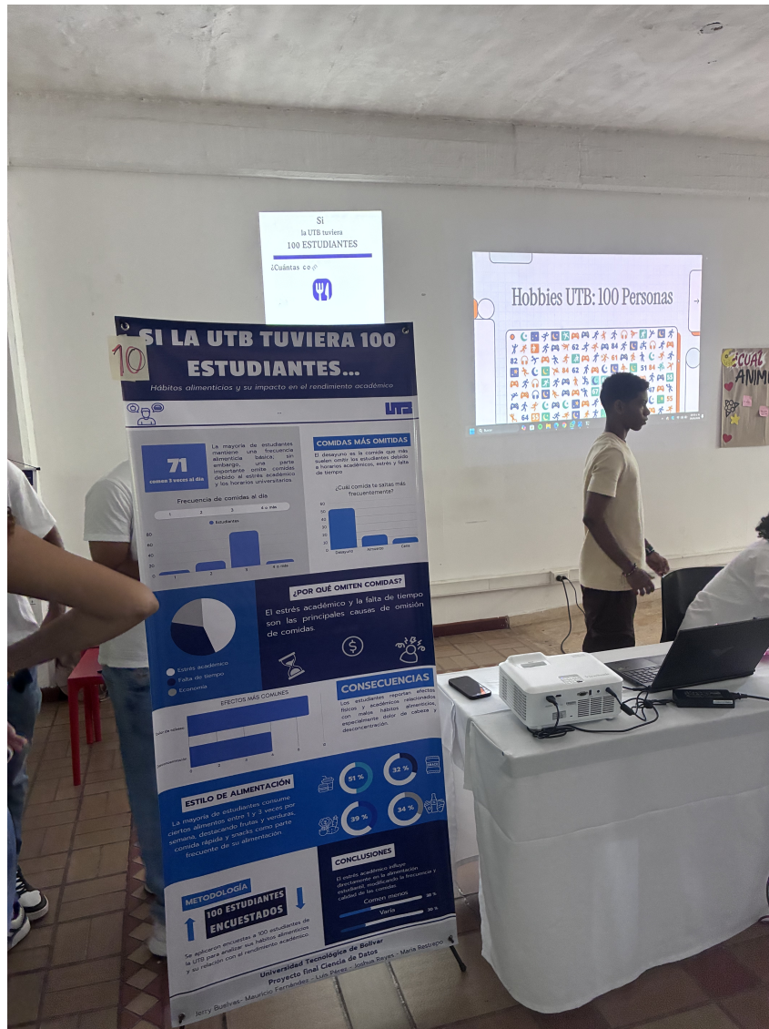
Figura 9.1: Todos nuestros chicos de la Feria de Ciencias de Datos en el Data Impact Day de los cursos de StoryTelling y Narrativa de Datos.