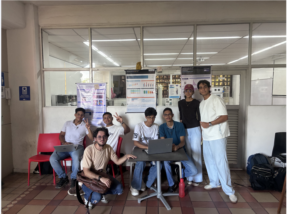
Figura 5.1: Todos nuestros chicos de la Feria de Ciencias de Datos en el Data Impact Day de los cursos de Modelos de Regresión y Series de Tiempo.