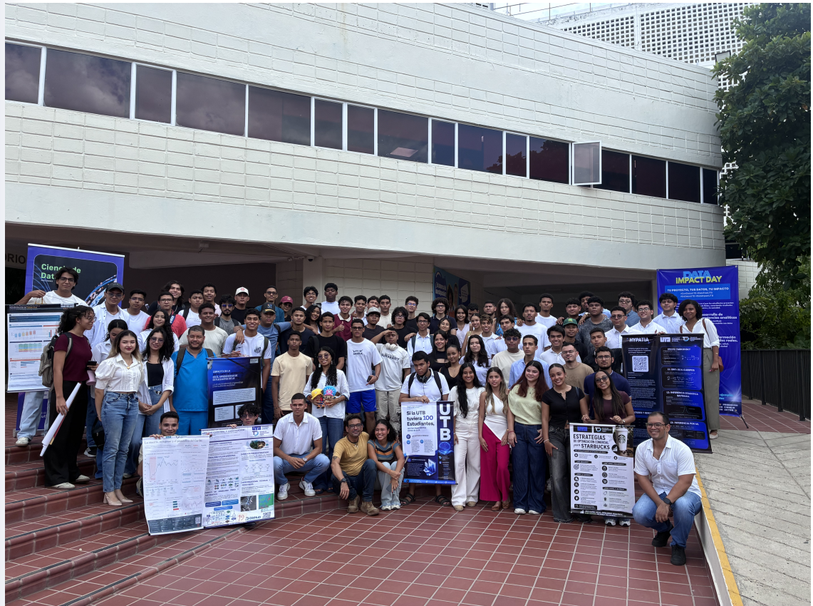
Figura 1: Todos nuestros chicos de la Feria de Ciencias de Datos en el Data Impact Day.

La socialización de los proyectos en formato de póster se llevó a cabo en los pasillos del Módulo A2 del primer piso del edificio principal.