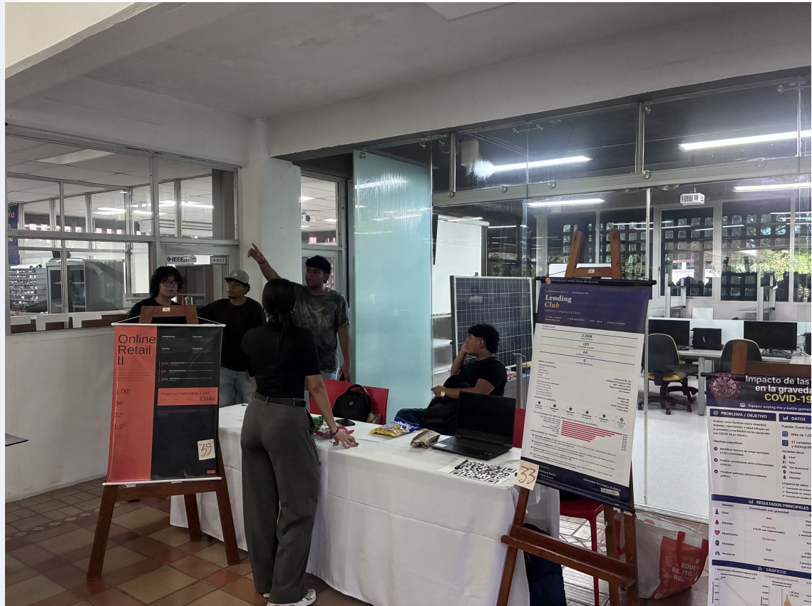
Figura 4.1: Todos nuestros chicos de la Feria de Ciencias de Datos en el Data Impact Day de los cursos de Programación para Ciencia de Datos.

Este proyecto analiza un dataset de vehículos usados para identificar los factores que más influyen en su precio de venta. Se utilizó el Car Details Dataset de Kaggle, que incluye variables como año del vehículo, kilometraje, tipo de combustible, transmisión, tipo de vendedor y número de propietarios anteriores. El estudio comprende procesos de limpieza y organización de datos, análisis exploratorio mediante gráficos y estadísticas, y la aplicación de técnicas de regresión lineal y agrupamiento. Los resultados permiten comprender el comportamiento del mercado automotriz de segunda mano y determinar las variables con mayor incidencia en el valor de los vehículos.