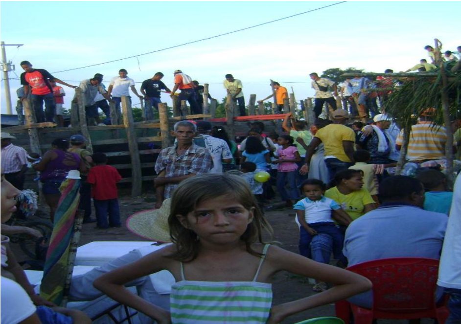
Fiesta de Corraleja