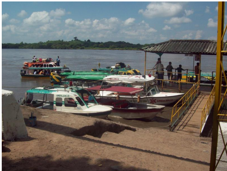
Foto 5. El puerto de San Martín de Loba. Foto tomada por Eneida Ramírez, marzo de 2011

Al revisar la cartografía del departamento de Bolívar se reproduce en la mente la percepción de que los ríos que lo recorren además de ser sinónimo de unión o integración entre las distintas poblaciones sobre los cuales despliega su cauces, son espectros fronterizos donde se engendra la autonomía y la autodeterminación de cada pueblo o caserío. Para Oslender (2001) esta percepción espacial se considera como la "lógica de los ríos"; el autor afirma que en las culturas fluviales los ríos son "las carreteras", siendo la columna vertebral de actividades económicas, sociales y rituales. El río es más que un cuerpo de agua, y esto es evidente en el municipio de San Martín de Loba, al observar la cotidianidad de sus habitantes, se nota cómo las poblaciones se juntan y entrelazan alrededor de las líneas de agua donde la atracción ejercida por el río, como puerta de