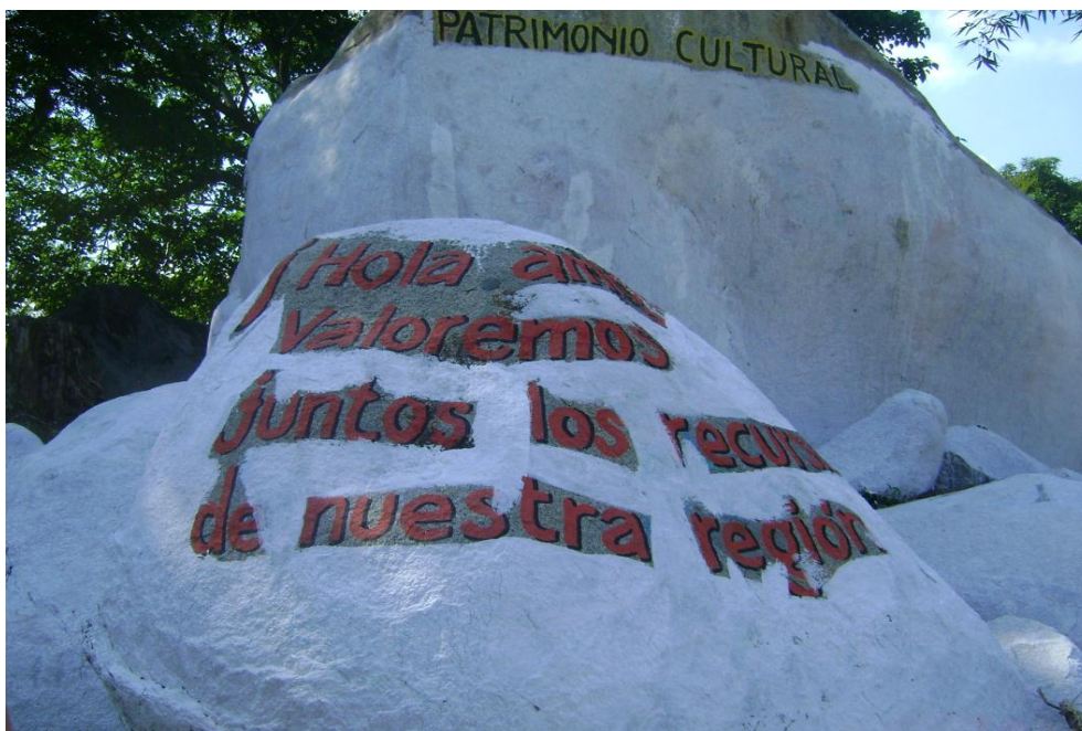
Piedra de Palacín, denominada por la comunidad como Patrimonio Cultural Foto tomada por Eneida Ramírez, en estudio de campo, 11 de noviembre de 2010.