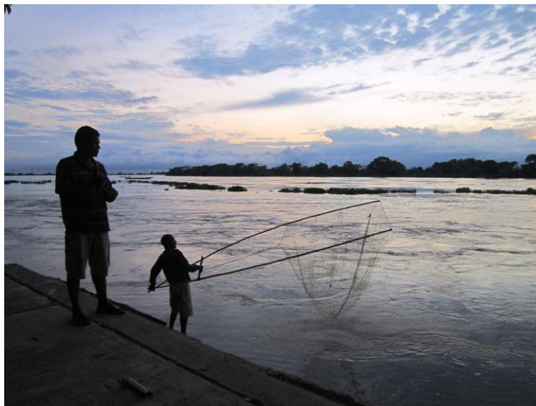
Foto 3. Una tarde de pesca. Foto Tomada por Eneida Ramírez, Abril de 2010

Cultivo de yuca y maíz: También se han afectado por el fenómeno de la niña, se espera que con los préstamos de la Corporación Colombia Internacional se reanuden el próximo año.