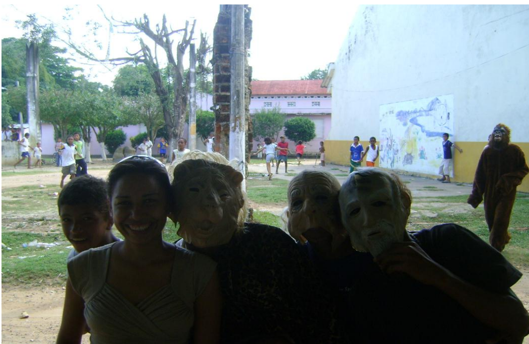
Fiesta patronal San Martín de Loba Máscara. Foto tomada estudio de campo 9 de Noviembre de 2010. Eneida Ramírez