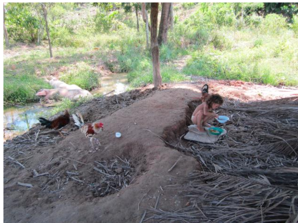
Fotos 1 y 2. Efectos de la minería. San Martín de Loba, Marzo de 2011.