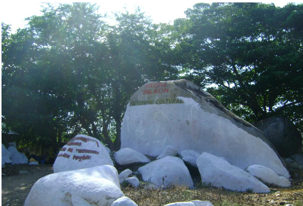
Piedra de Palacín, denominada por la comunidad como Patrimonio Cultural Foto tomada por Eneida Ramírez, en estudio de campo, 11 de noviembre de 2010.