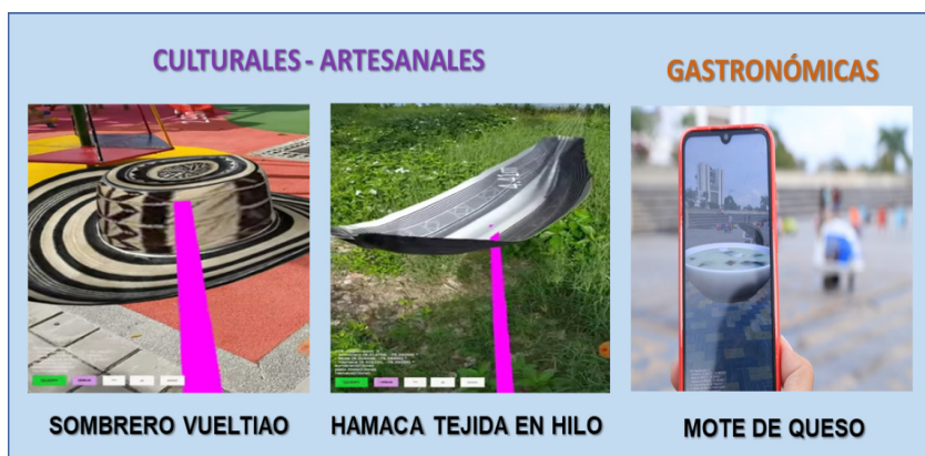
Imagen 4 Modelos 3D de expresiones culturales – artesanales y gastronómicas