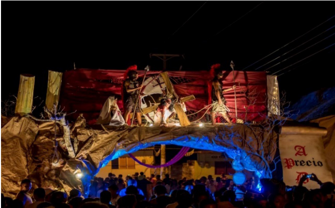
Imagen 1 Cuadro: A precio de sangre