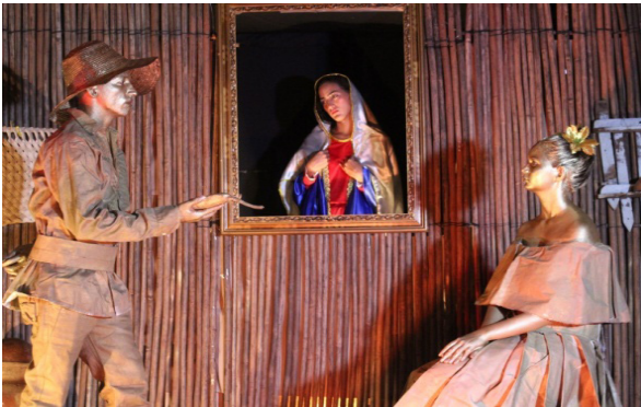
Imagen 2 Cuadro: Cuna de tradiciones