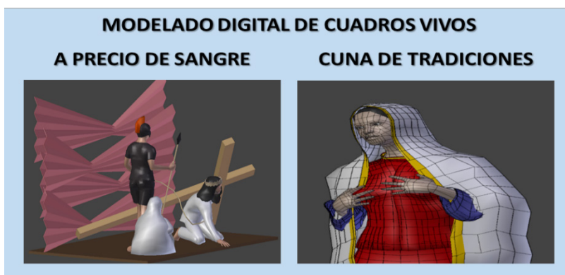
Imagen 3 Modelado para aplicativo de los cuadros vivos ganadores año 2020

de la categorización realizada para la difusión mediante la herramienta tecnológica para posibles turistas y empresarios del turismo en Sucre.