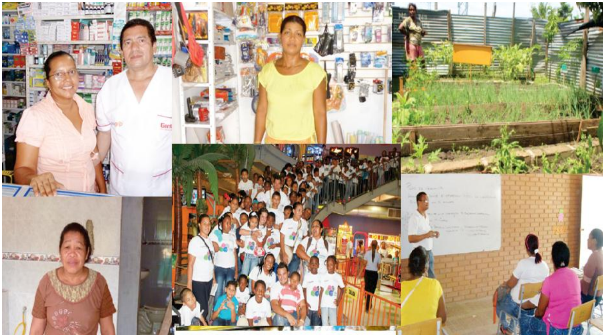
18. beneficiarios de créditos. ACTUAR por Bolívar