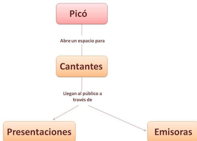
Ilustración 1: ¿Cómo funciona la industria musical de la champeta en Cartagena?