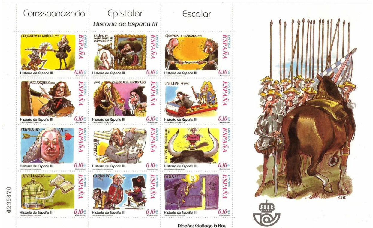
Figura 4. Historia de España III. Siglos XVII y XVIII (2002).

Las dos últimas hojas [“Historia de España I. Siglo XIX” / “Historia de España II. Siglo XX”] (Figuras 5 y 6) fueron un reinicio completo de la secuencia histórica, teniendo estas láminas características propias. Ya no se patrocinaba a la correspondencia epistolar escolar, se presentaba un único sello en el lateral de la hoja acompañado de doce pequeñas ilustraciones sin valor facial y desapareció el logo corporativo de Correos en los laterales. Paradójicamente, aunque los títulos de las dos últimas hojas delimitaban su marco temporal de cada una de ellas, una rápida visión de las mismas reflejaba todo lo contrario. Obsérvese, a modo de ejemplo, las viñetas de Alfonso XIII (presente en la tabla del siglo XIX a pesar de que su reinado personal se inició en el año 1902) o las dos primeras imágenes de la tabla del siglo XX (cuya temática gira en hechos del siglo pasado).