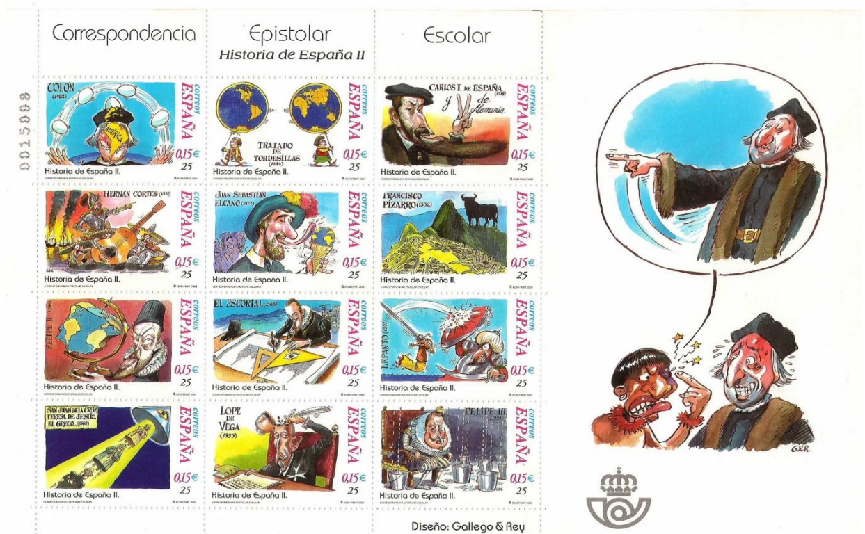
Figura 3. Historia de España II. Época moderna (2001).

La cuarta hoja, nombrada “Historia de España III. Siglos XVII y XVIII” (Figura 4), exhibiendo ya únicamente su precio postal en euros, fue la que presentó más elementos asociados con el campo de las artes al aparecer caricaturizados autores como Cervantes, Quevedo, Góngora, Jovellanos y Velázquez; siendo también referenciadas obras de este pintor a través de dos de sus cuadros: en la imagen del lateral de esta hoja por medio de una escena de “La rendición de Breda” y un autorretrato ecuestre de Gaspar de Guzmán en la viñeta “Felipe IV. Conde-Duque de Olivares”.