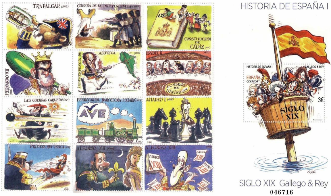
Figura 5. Historia de España I. Siglo XIX (2017).

La postrera hoja (Figura 6) tuvo como primera imagen al dramaturgo gallego Ramón María del Valle Inclán y acabaría con el reinado de Juan Carlos I, citando también este documento a otro literato (Rafael Alberti) y diversos acontecimientos históricos (tales como la guerra hispano-estadounidense, el desastre de Annual o la revolución de Asturias) y a un único científico: Ramón y Cajal (habiéndose contabilizado a tres hombres de ciencias en todo el conjunto si consideramos al rey Alfonso X y a Jovellanos como tales).