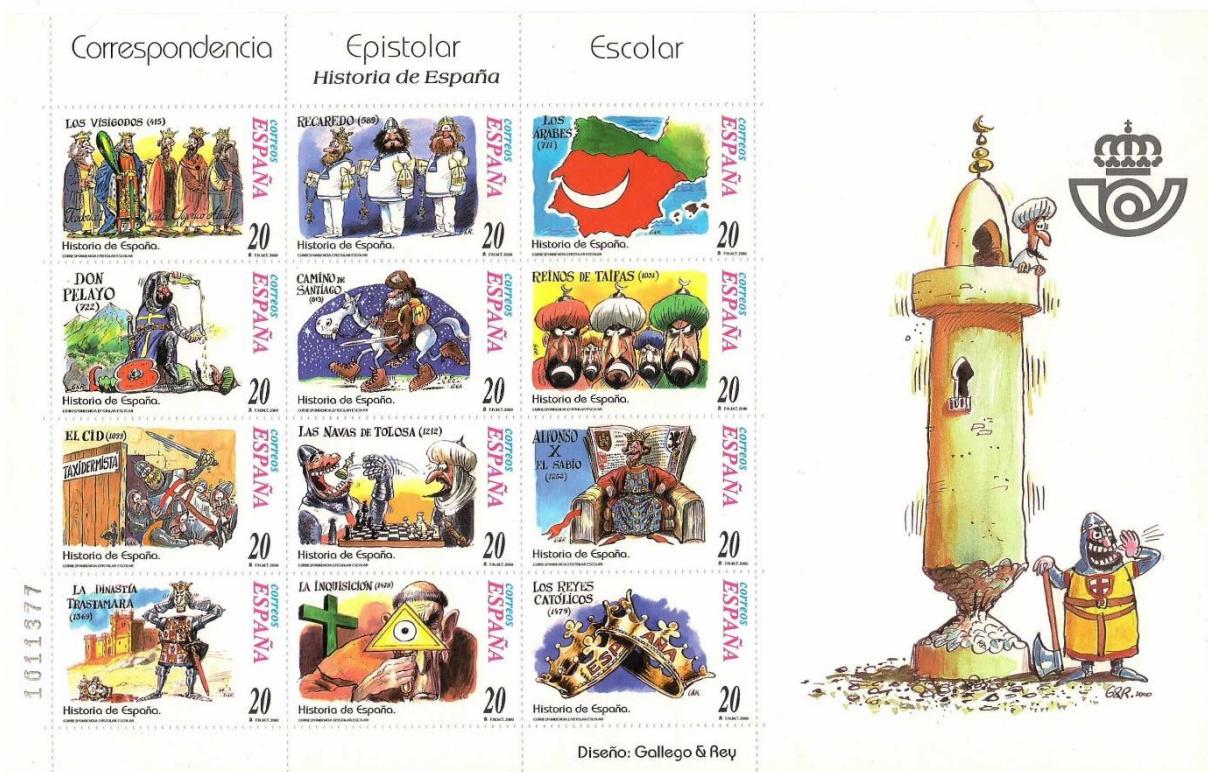
Figura 2. Historia de España. Época medieval (2000).

La tercera hoja de la colección, titulada “Historia de España II” (Figura 3), se centraría en los inicios de la Edad Moderna (desde el primer viaje colombino hasta el reinado de Felipe III) enfatizándose el descubrimiento de América y la colonización española de este continente. El producto mantuvo las mismas características físicas que sus antecesoras e introduciendo su precio respectivo en euros (0,15€), la nueva divisa comunitaria que el país adoptó en el año 2002. Esta