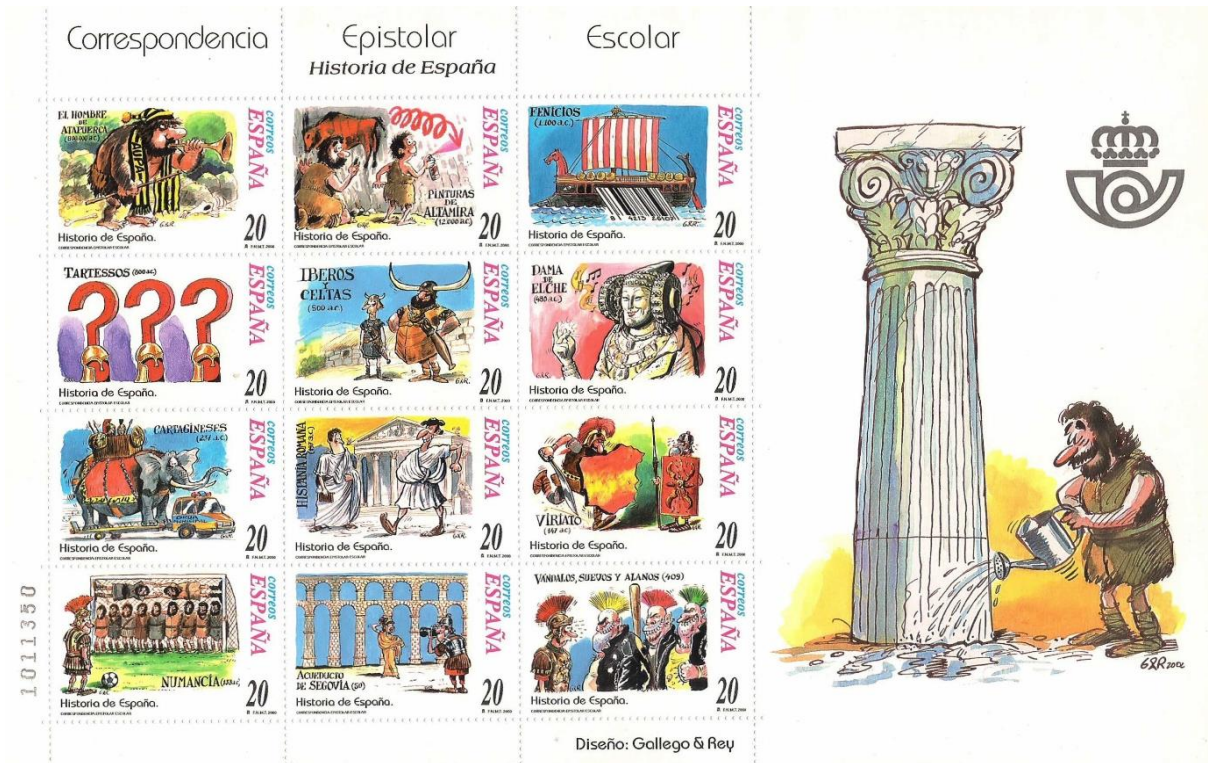
Figura 1. Historia de España. Época prehistórica y clásica (2000).