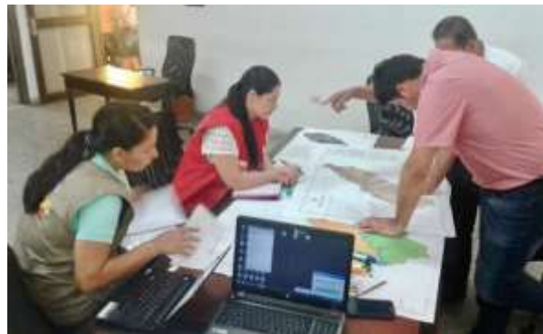
Ilustración 6. Ejercicio de distribución Unidades Básicas de Planeación y Socialización PDET Agremiaciones.

Sexta y última robada de la Silla Vacía (2017), debe haber claridad y amplia divulgación de la metodología de trabajo en todos los niveles . Los acuerdos que se aprobarán en las asambleas de veredas, municipios y subregiones deben ser el resultado de escenarios de participación real e informada, donde las comunidades y organizaciones sociales, que ordinariamente no cuentan con acompañamiento ni asesoría, puedan ver reflejada su visión de desarrollo.