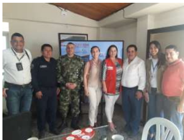
Ilustración 5. Socialización Ruta PDET con Institucionalidad.