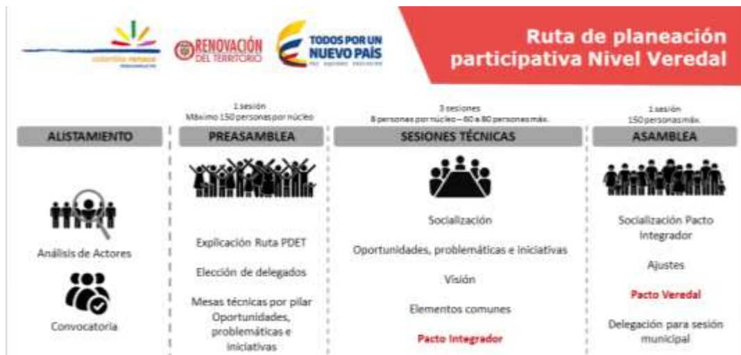
Ilustración 2. Planeación Participativa, Nivel Veredal.