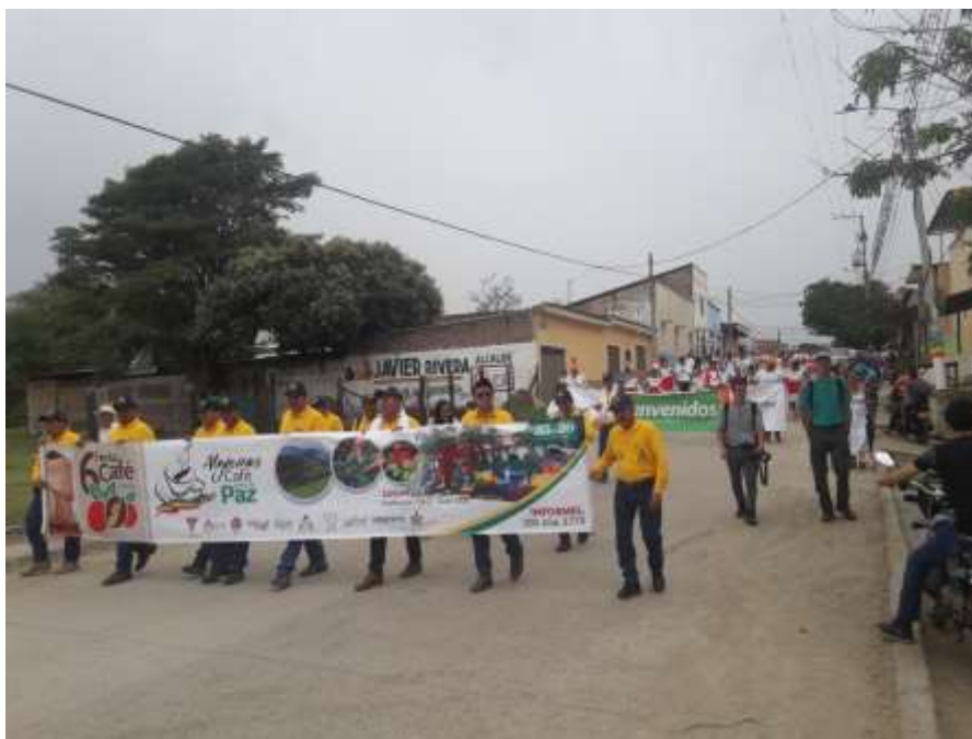
Ilustración 4. Feria del Café “Algeciras para la Paz”, 25/08/2017.

y por construir enfoque territorial en juventudes en calidad de ser la última generación de la guerra y la primera de la paz. En esa misma línea, considera la participación de excombatientes en el proceso como eje fundamental y potenciador para su reincorporación a la vida civil. No está de sobra agregar que la gestión de la ART impulsará otras acciones de acompañamiento al proceso tales como pedagogía de paz y fortalecimiento de capacidades, entre otras. Todo lo anterior sin perjuicio de otras iniciativas de construcción de paz que puedan darse en el territorio.