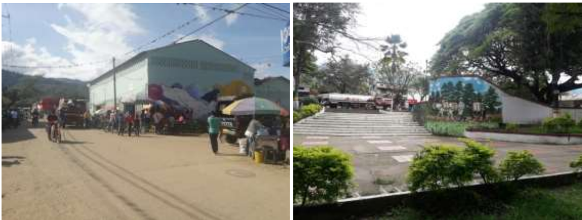
Ilustración 6. Galería y Plaza Municipal, Algeciras.

Hay que reconocer entonces que debido a la estructura misma de la política pública en Colombia, en donde se da una división presupuestal por sectores, que obliga a las entidades a cumplir con metas sectoriales, que no tienen en cuenta el contexto territorial, dificultando que esta perspectiva se consolide en programas y proyectos tangibles que beneficien a los territorios rurales en su conjunto y acorde a sus necesidades.