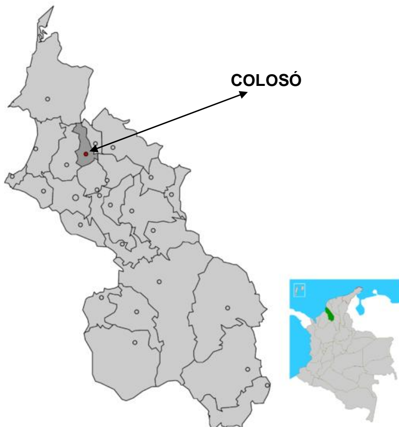
Ilustración 2. El municipio en el departamento de Sucre

28 El Carmen de Bolívar 29 Córdoba 30 El Guamo 32 María La Baja 33 San Jacinto 34 San Juan Nepomuceno 35 Zambrano