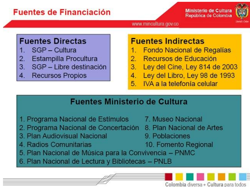
Imagen 2. Fuentes de financiación para la cultura en Colombia.