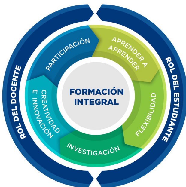
Gráfico 2 Principios del modelo pedagógico en la UTB

La tarea docente apunta a estimular la formación integral mediante un conjunto de estrategias didácticas y pedagógicas desarrolladas por él para fomentar el aprendizaje de los estudiantes; esto implica: